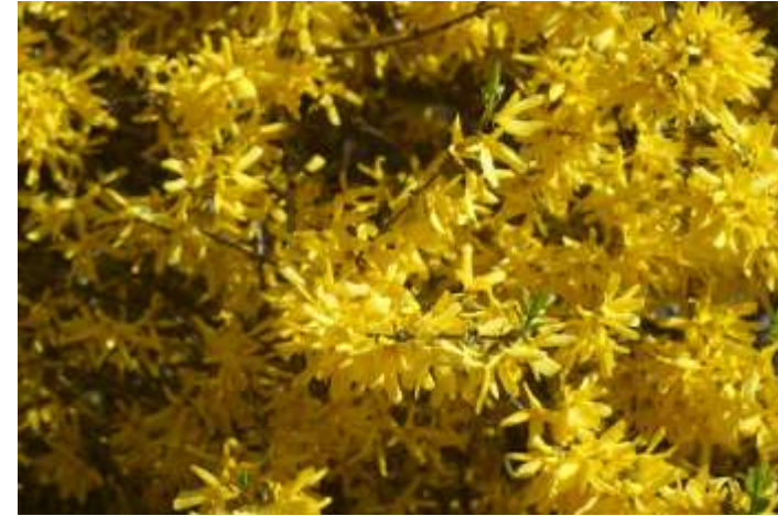
Bewertung nach dem in der Gehölzsichtung üblichen Bewertungsschemas

Sehr frühe gelbe Blüte, anspruchslos Verzeiht viele Schnittfehler Im Alter stark überhängend