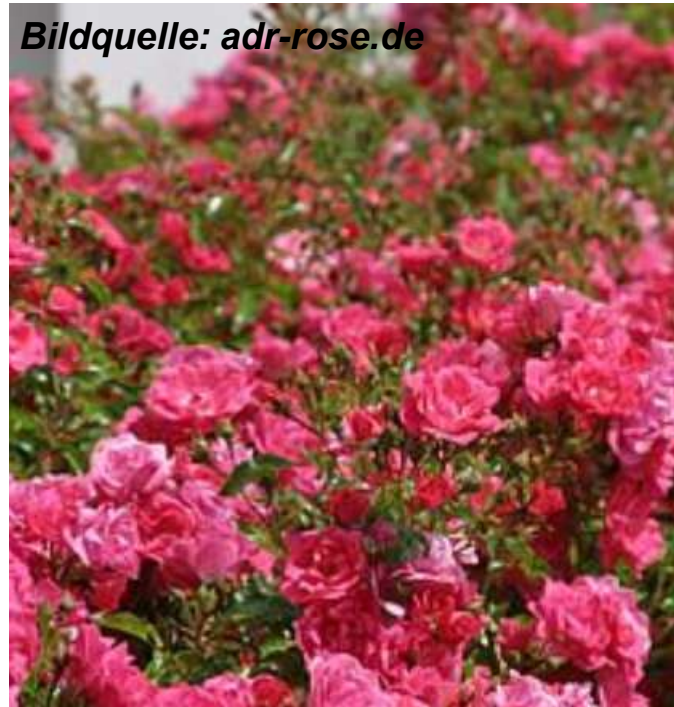
Heidetraum (Noack, ADR 2021), 80 cm