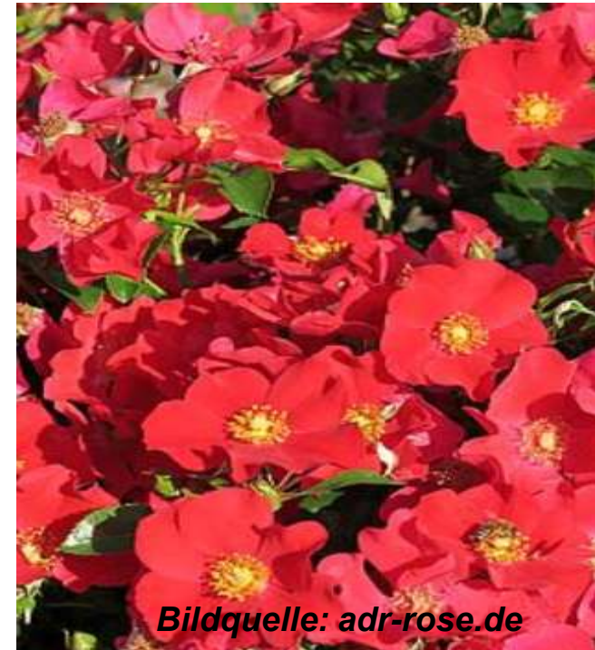
Alexander v. Humboldt (Kordes, ADR 2019), 60 cm