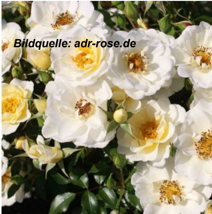
Bienenweide Ivory (Tantau, ADR 2024), 60 cm